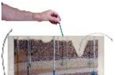
... teinter ...