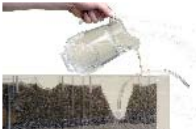
Remplir d'eau ...

Ce matériel est avant tout destiné aux enseignants qui traitent les eaux souterraines en classe. La pièce maîtresse de l'ensemble est une maquette qui illustre de manière fascinante les processus qui se déroulent en grand secret dans le sous-sol et permet ainsi de les comprendre.