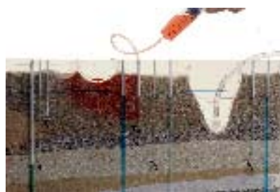
L'eau d'infiltration traverse une décharge mal étanchéifiée et pollue le captage d'eau souterraine.

«... J'ai utilisé ce matériel didactique et les exercices (valise et brochure) avec des élèves de différents niveaux (du cycle d'orientation à la maturité). Et j'ai eu le plaisir de constater qu'il est possible d'adapter les expériences à chaque niveau. On voit que ce produit a été conçu par des professionnels, à commencer par l'emballage, la clarté du mode d'emploi, les informations fournies sur les différents supports, l'adéquation au public cible jusqu'à la conception méthodologique et didactique. Je ne puis qu'applaudir! C'est un outil de travail précieux pour les enseignants des classes secondaires. ...»