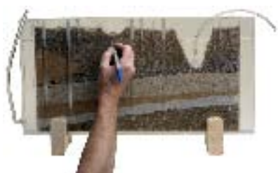
... marquer les niveaux ...